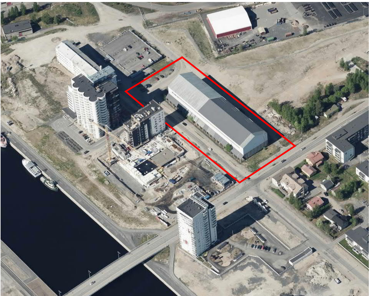
Kuva 1: Suunnittelualueen viistoilmakuva 2018

Asemakaavan muutoksen tavoitteena on korttelin 53 tontin 9 käyttötarkoituksen muuttaminen asuin- ja liikerakennusten alueeksi. Hakija on laadittanut kaavamuutoksen pohjaksi alustavan esityksen rakentamisen määrästä ja laadusta.