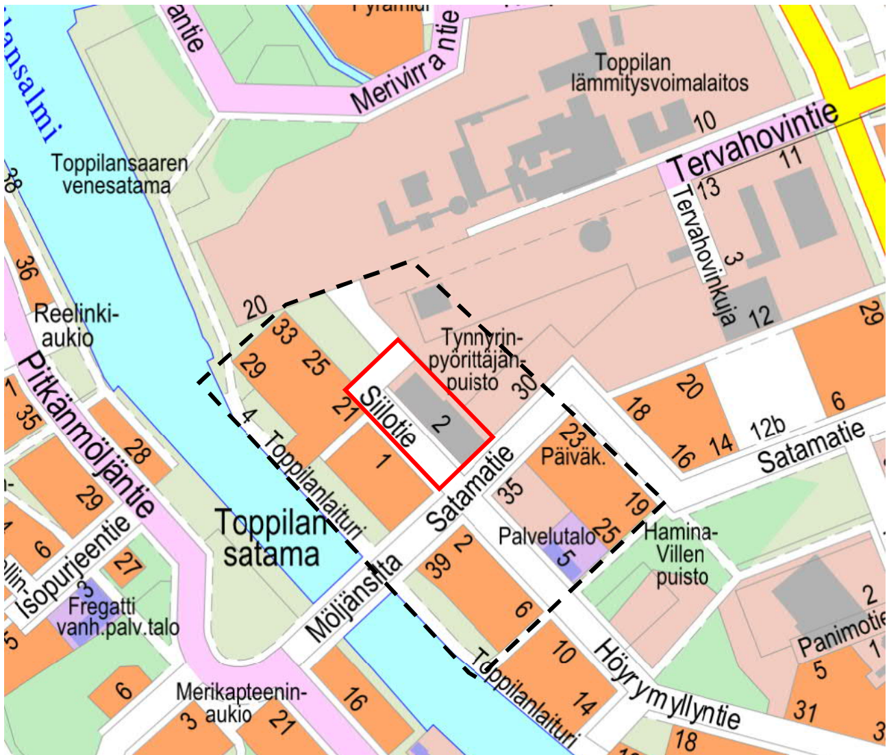
Kuva 1, Suunnittelualue (punainen viiva) ja tiedotusalue (musta katkoviiva).

Toppilan kaupunginosassa, osoitteessa Siilotie 2, on tullut vireille asemakaavan muutos tontin haltijan aloitteesta. Tavoitteena on muuttaa Korttelin 53 tontin 9 käyttötarkoitus lähipysäköintialueesta asuin- ja liikerakennusten alueeksi. Suunnittelualueella sijaitsee vanha kemikaalivarasto, jonka hahmo on edellytetty säilytettäväksi kaupunkikuvallisista syistä. Asemakaavan on tarkoitus valmistua keväällä 2021.